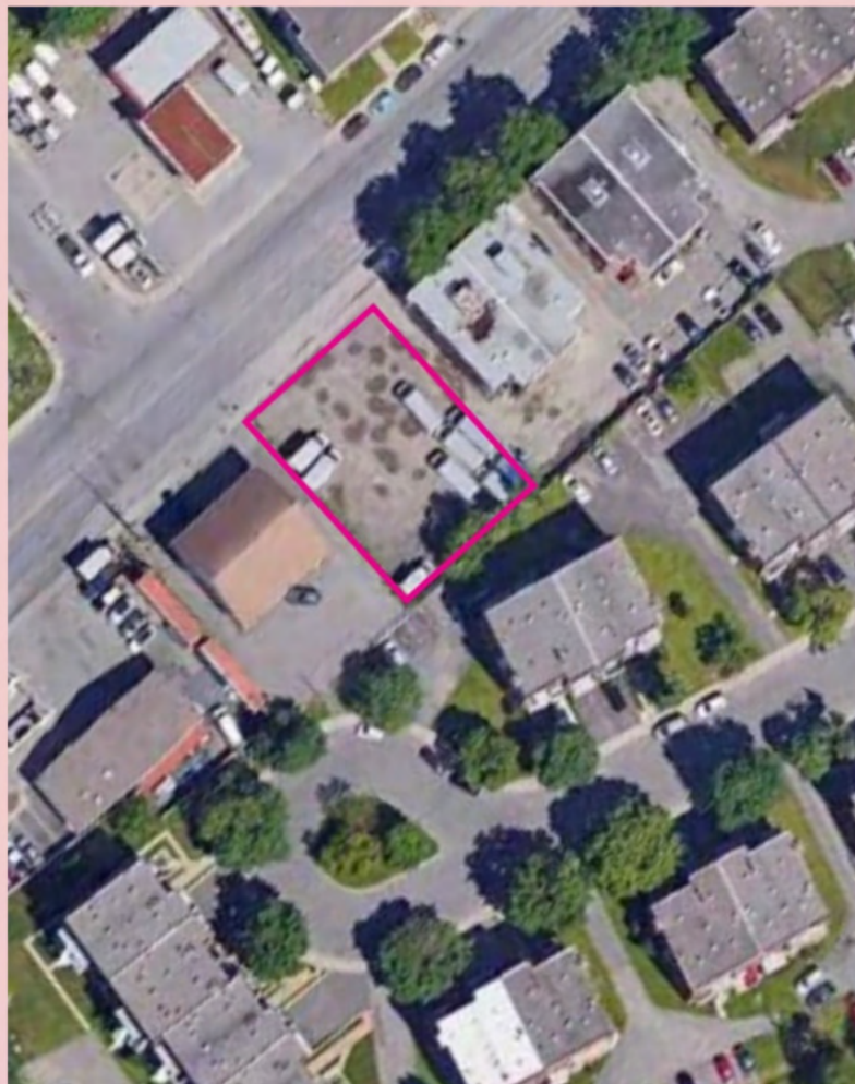
Photo du terrain visé pour la construction du projet d'hébergement utpELLES

Depuis sa fondation en 2018, utpELLES travaille à la recherche de solutions pour faciliter l'accès au logement et à l'hébergement pour les femmes ayant un vécu dans la prostitution, en tenant compte des impacts que cet accès peut avoir dans la sortie ou le maintien des femmes dans l'industrie du sexe.