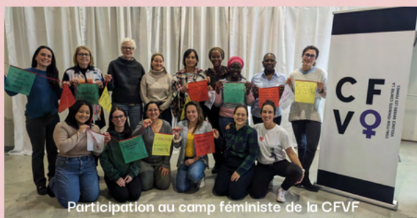
Participation au camp féministe de la CFVF

Par ailleurs, nous avons rejoint la Coalition féministe contre la violence envers les femmes (CFVF) en tant que membre associatif, et avons activement participé à plusieurs de leurs initiatives tout au long de l'année.