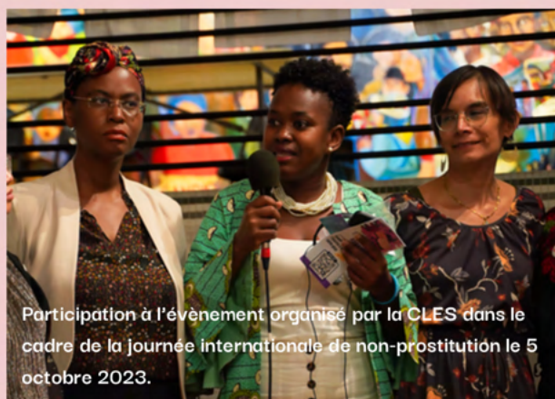
Participation à l'événement organisé par la CLES dans le cadre de la journée internationale de non-prostitution le 5 octobre 2023.

De plus, nous avons participé à la journée de sensibilisation à l'occasion de la journée internationale de non-prostitution le 5 octobre, qui a été organisée par la CLES à l'écomusée du fier monde. Enfin, notre engagement envers les questions sociales s'est également reflété lors de notre participation à un panel de discussion sur la crise du logement, le 8 mars dernier, à la Maison d'Haïti. Ces différentes actions témoignent de notre détermination à contribuer activement à la promotion des droits.