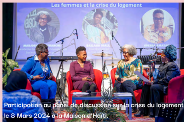
Participation au panel de discussion sur la crise du logement le 8 Mars 2024 à la Maison d'Haïti.

Cette année, notre engagement envers la cause féministe s'est manifesté à travers plusieurs représentations et collaborations significatives. Nous avons maintenu notre participation active à la Table des groupes de femmes de Montréal (TGFM), ainsi qu'à diverses rencontres de revendications féministes.