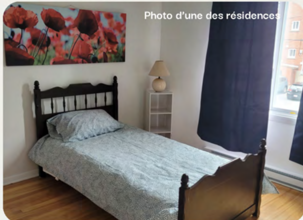
Photo d'une des résidences

Il s'agit d'une initiative mise en œuvre par utpELLES pour pallier un vide existant dans l'offre de services au niveau de l'hébergement et du logement pour les femmes et filles victimes d'exploitation sexuelle sur l'île de Montréal. Le projet des résidences d'urgence a débuté en 2021 et offre actuellement 5 lits d'urgence dans des appartements meublés pour les femmes ayant un vécu en lien avec l'industrie du sexe à risque d'itinérance et/ou en démarche de sortie de la prostitution.