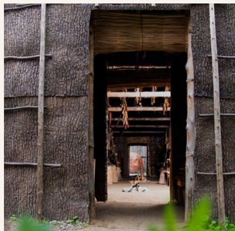
Photo: Maison longue nationale de Wendake (Québec)

Les déplacements et la sédentarisation forcée hors d'un contexte biopsychosocial traditionnel et spirituel ont augmenté et accéléré le mouvement des Premiers Peuples vers les villes. 4 Les conditions de vie dans les communautés étant très difficiles ; ; « En outre, les logements et les infrastructures dans les réserves continuent d'être gravement sous-financés, ce qui encourage la migration vers les centres urbains. Par exemple, le manque de plomberie et d'électricité, la mauvaise isolation,